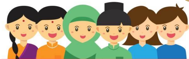
Rakyat & NGO

Penyampaian & Libat Urus: Budaya Politik Matang & Sejahtera (BPMS)