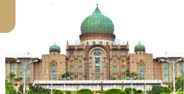
Pegawai & Badan Kerajaan